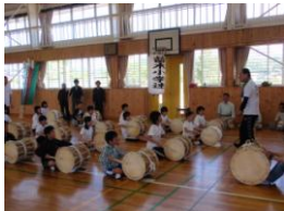
風流おどり小学連の練習風景

今年も「あんどん祭り」の季節がやってきました。実行委員会が中心となって準備が進められており、学校・保育園・区長さんを通じてお願いしましたあんどんの絵も集まりました。区民の皆さん、また事業所の皆さんには、協力金・協賛金として多数ご協力いただき、ありがとうございます。