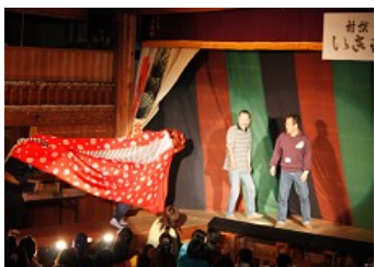
井汲獅子に追われて登場