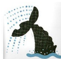
「くじらのバース」より