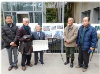
石原副会長と同席された会員の皆さん

花で美しく彩られた花壇は通り掛かった人の心まで温かくしてくれます。「苗木花の会」の皆さんおめでとうございます。そしていつもありがとうございます。