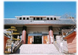
在籍されている苗木遠山史料館