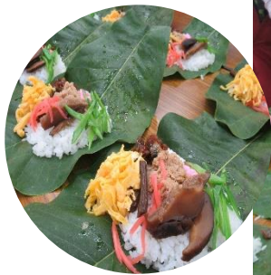
色とりどりの具材が載った朴葉寿司