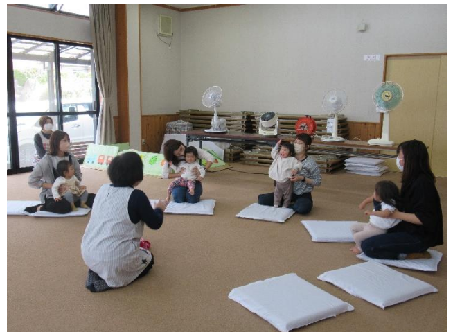
交流を深める親子連れ