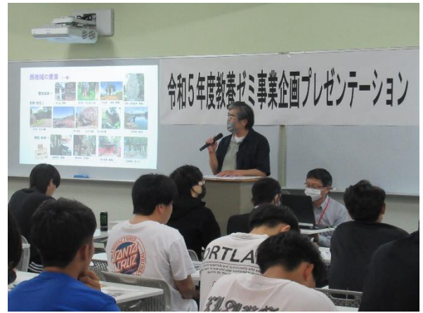
地域の課題についてのプレゼンテーション

今後、学生が実際に現地へ出向いてフィールドワークを行い、地域の魅力の再発見につながるような、“歩きたくなる”マップ作りに取り組みます。