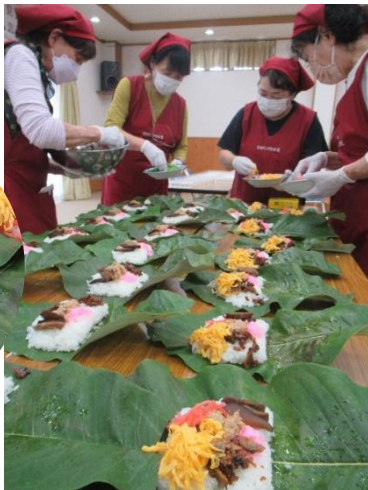
朴葉寿司を作るメンバー