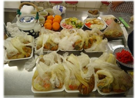
袋のまま、お湯で温めて食べます