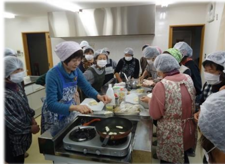
作った料理はポリ袋に入れます

1月23日(木)に活性化センターで、日赤奉仕団蛭川支部が炊出し訓練を行い、防災パッキングをしました。パッキングとは、ポリ袋に食材を入れて湯せんで火を通す調理法で、ガスや水道、電気などのライフラインが使えなくなっても、カセットコンロ、鍋、水、ポリ袋を準備すれば、簡単な食事を作って食べることができます。災害に備えるために、日常生活にも取り組みたい調理法です。