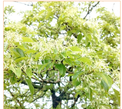
ひとつばたごは「一ツ葉タゴ」という意味

ひとつばたごは日本では岐阜県、長野県、愛知県、長崎県対馬のみに自生する希少種で、絶滅危惧Ⅱ類に指定されています。この美しい地域の宝物を、みんなで大切に守り続けていきましょう。