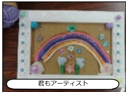
君もアーティスト