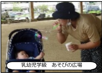
乳幼児学級 あそびの広場