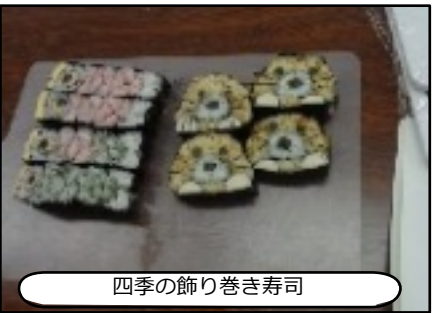
四季の飾り巻き寿司