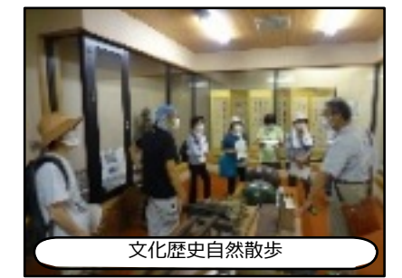
文化歴史自然散歩