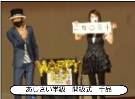
あじさい学級 開級式 手品