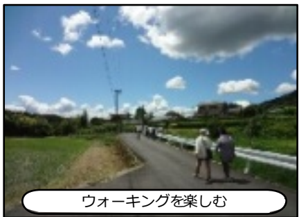
ウォーキングを楽しむ