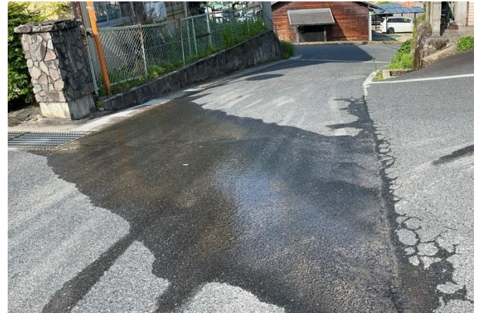
漏水すると道路はこんな状態になります

【お問い合わせ】中津川市役所環境水道部水道課 0573-66-1111 (内線515)