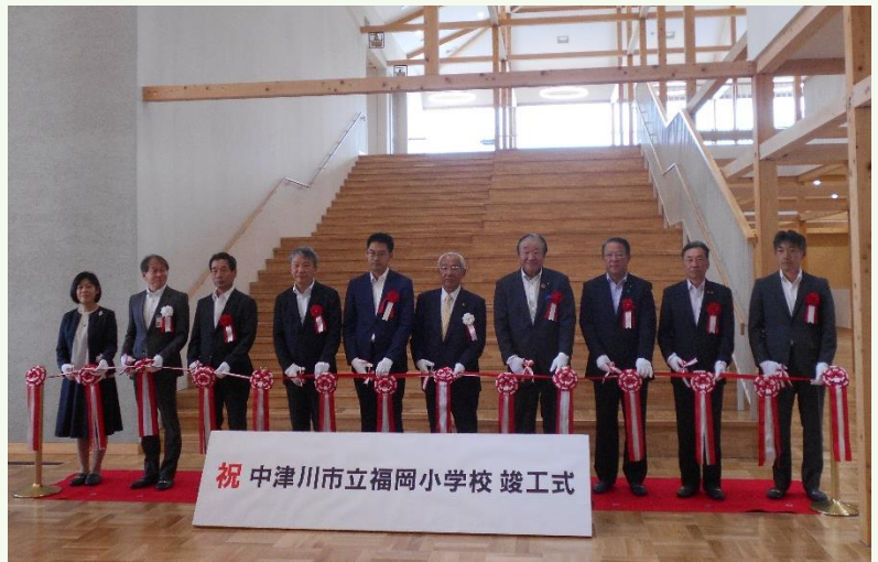
竣工式でテープカットを行う青山市長（中央）ら関係者

竣工式後には、見学会が行われ地域住民の方々が新しい学校に興味深そうに見学していました。