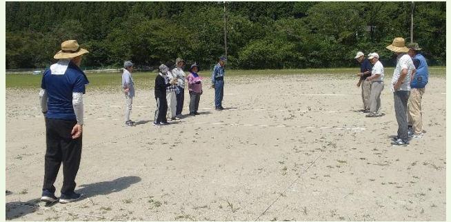
北グラウンドではペタンクが開催されました