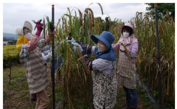
抜穂作業のようす（令和4年9月2日）