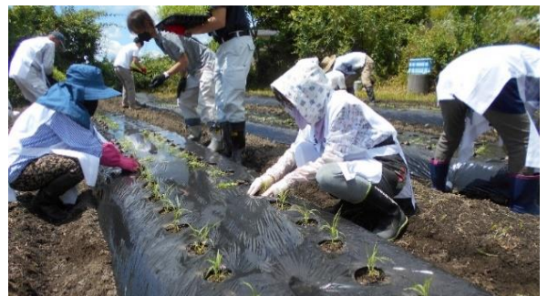
定植作業のようす（令和4年6月8日）

粟の生産は、初めての試みでしたが、農事組合法人はちたかのみなさんをはじめ、農協、恵那農林事務所など多くのみなさんのご協力によりすばらしい粟に育ちました。