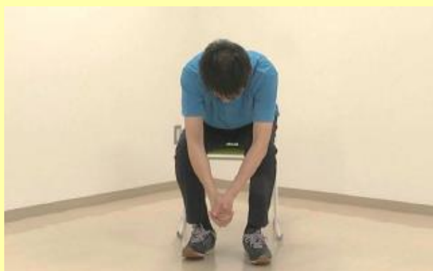
浅く腰を掛けて両手を軽く前に出して組みます。