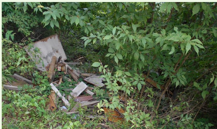
八本木林道から不法に投棄された廃棄物

不法投棄をした場合、廃棄物（ごみ）の撤去を求められるとともに罰金が科せられることが法律で定められています。不法投棄は絶対にやめましょう。