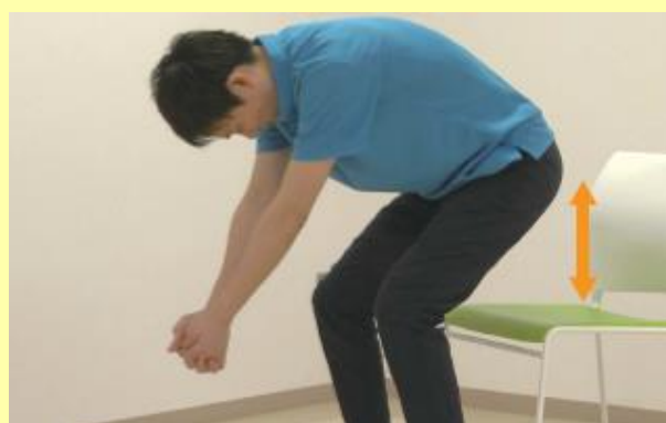
そのままゆっくりおしりを持ち上げて止めて、そこからゆっくり下ろすを繰り返します。