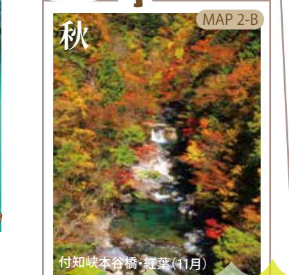
付知峡本谷橋・紅葉(11月) MAP 2-B