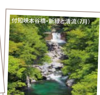
付知峡本谷橋・新緑と清流(7月) MAP 2-B