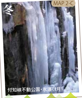
付知峡不動公園・氷瀑(1月) MAP 2-C