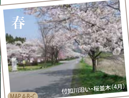
付知川沿い・桜並木(4月) MAP 4-B・C

落差約20mの見事な直瀑を見ることが出来る滝です。豊富な水量から天気の良い日には滝壺付近に虹が架かります。また、橋や眺望台が整備されており、滝を上下の視点から楽しむことができ、知る人ぞ知るスポットです。