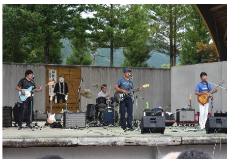
様々なステージアトラクションが会場を盛り上げました