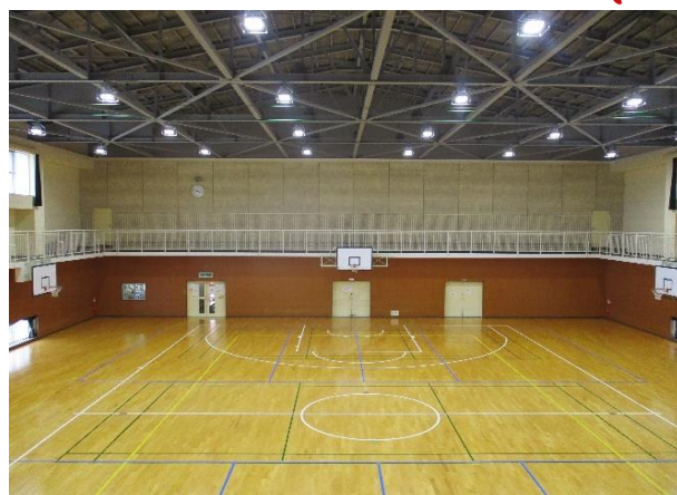
【より安心・安全な施設となりました】