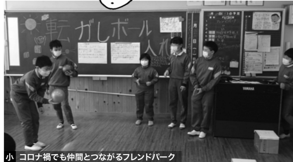
小 コロナ禍でも仲間とつながるフレンドパーク