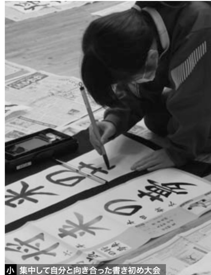
小 集中して自分と向き合った書き初め大会