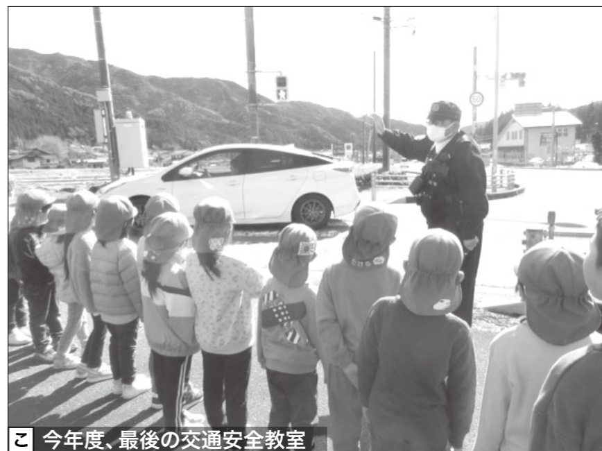
こ 今年度、最後の交通安全教室