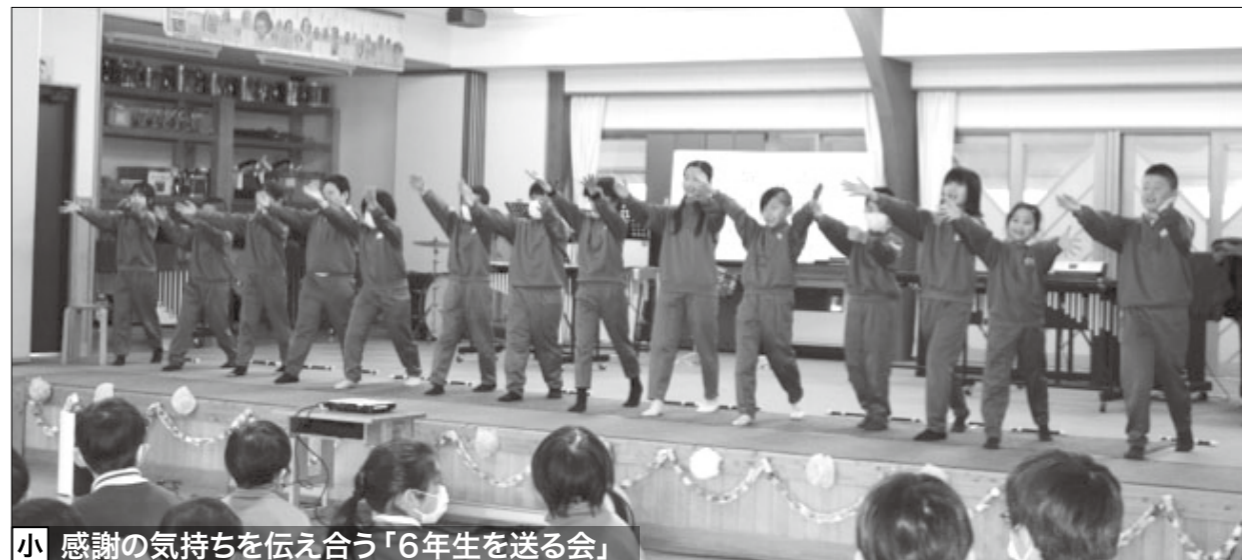
小 感謝の気持ちを伝え合う「6年生を送る会」