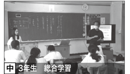
中 3年生 総合学習