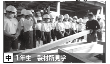
中 1年生 製材所見学