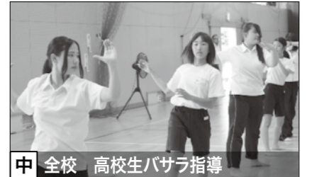
中 全校 高校生バサラ指導

中学校 ▶ 4月より本当に多くの地域の方々に来校していただき、沢山の大切なことを中学生は学ばせてもらいました。地域のことであったり、運動のことであったり、生き方のことであったりその内容は豊かで多くの発見と驚きがありました。中学生は年齢の近い先輩や大人たちと関わることで、自分にはない考え方を知ったり、「なりたい大人像」をつくったりしていきます。夏休み明けからも沢山の地域の先生達と一緒に学び、成功、失敗の体験を通して自立した大人になる勉強をしていきたいと考えています。