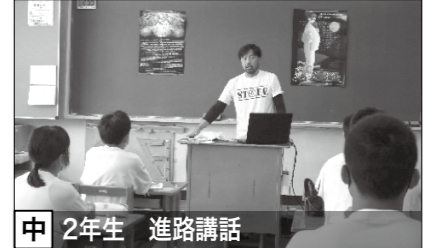
中 2年生 進路講話