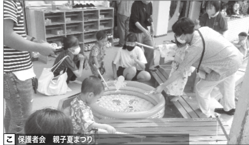
保護者会 親子夏まつり