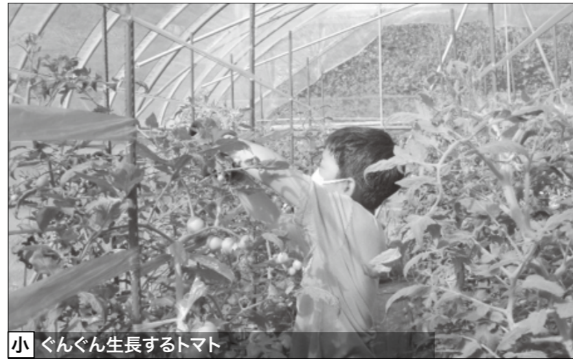
小 ぐんぐん生長するトマト