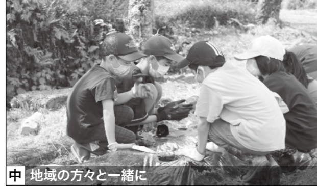
中 地域の方々と一緒に