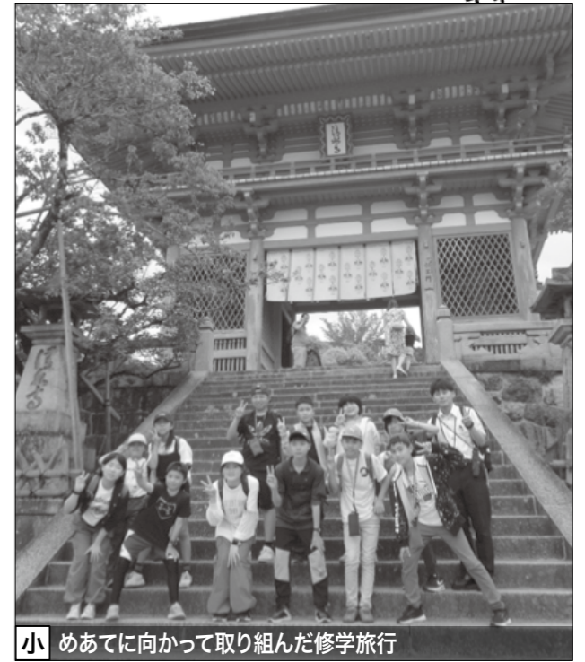
小 めあてに向かって取り組んだ修学旅行

中 学校 ▶ 6月4日は加子母環境デーでした。数日前まで激しい雨が降っており、天候も心配されていましたが、朝から快晴で6月とは思えない強い日差しの中、ペゴニアの苗を植えることができました。花植えの作業を通し、近所の方々から「おはよう」「頼むね」「頼りになるわ」「若い子たちと話す元気もらえるわ」等の言葉を掛けてもらいました。 中学生たちから話を聞くと、いつもとは違った世代の方との関わりの中で「自分も役に立っているんだ」とか「こんなことぐらい、すごく喜んでもらえるんだ」とか「頼りにされるって気持ちがいい」という発見や喜びがあったようです。 また、近所の小学生からも色々な質問をされたり、「手伝って」と言われたりしていて、楽しそうな様子も見られました。気のせいなのか、いつもより一人一人の顔が誇らしげで、頼もしく感じられた初夏のすがすがしい一日でした。