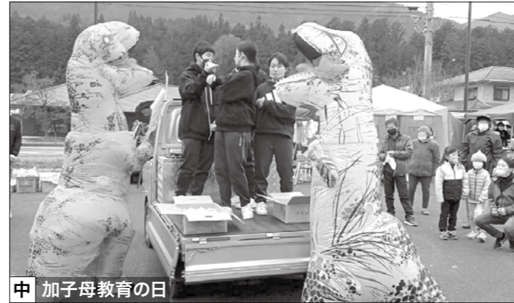
中 加子母教育の日