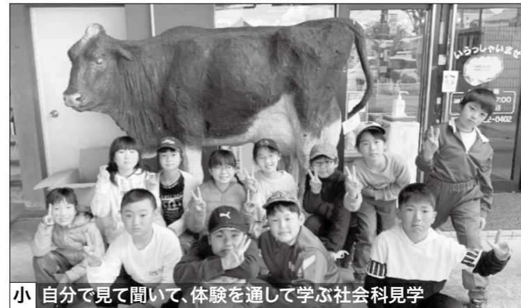
小 自分で見て聞いて、体験を通して学ぶ社会科見学