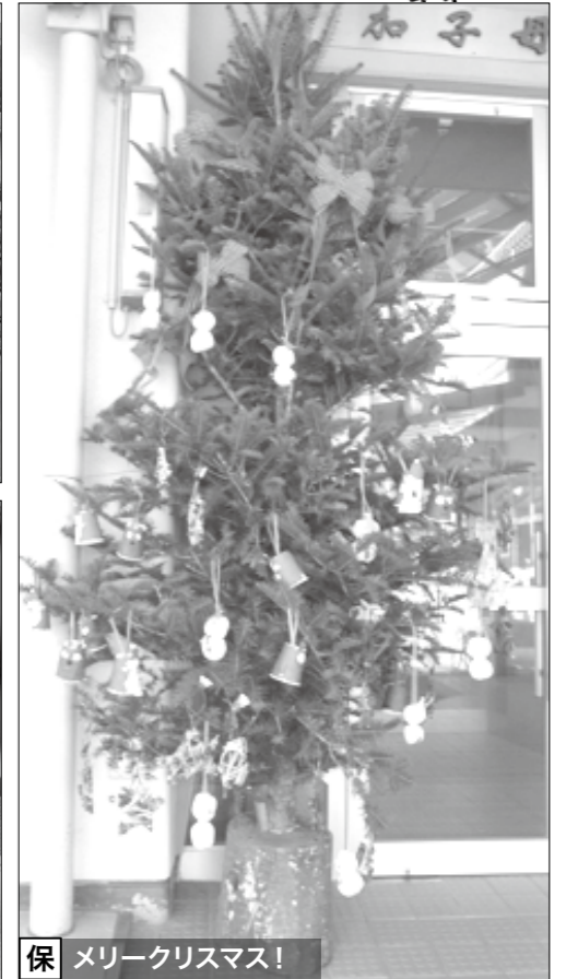
保 メリークリスマス！

中 学校 ▶ 今年の「加子母教育の日」、本校3年生は、15年間加子母で成長してきたことの総まとめとして、「ふるさと加子母のためにできること」をテーマに取り組みました。その取組の一環として、12月11日(日)、道の駅での「軽トラック朝市」に参加させていただきました。地域にお住いの皆さんにも、他地域から訪れている皆さんにも、小さな子どもたちにも、お年寄りの皆さんにも、全てのみみなさんに加子母を知ってもらい、加子母を楽しんでいただくにはどうしたらいいのか、生徒は様々に考え、判断して取り組みました。12月初めの寒い日でしたが、笑顔いっぱい心温まる軽トラ朝市になったのではないかな…と思っています。