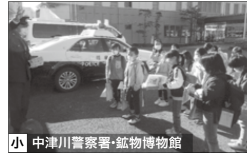
小 中津川警察署・鉱物博物館