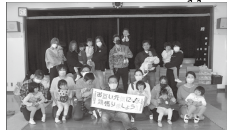
保 家族参観～積み木とビーズのワークショップかしもっこ広場～七五三交流会～