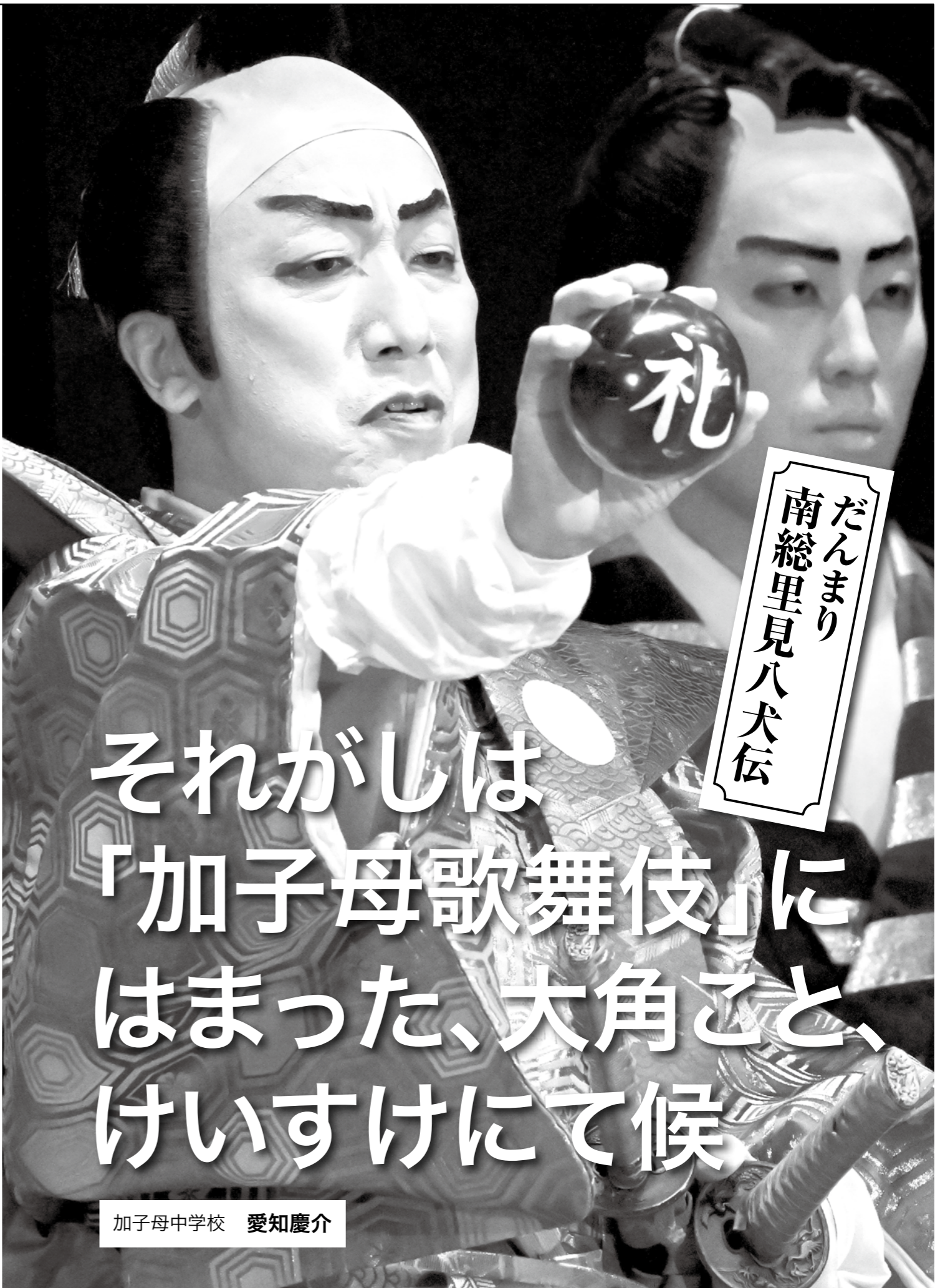
だんまり 南総里見八犬伝