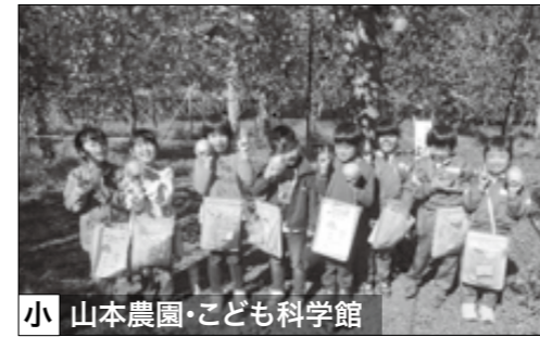
小 山本農園・こども科学館