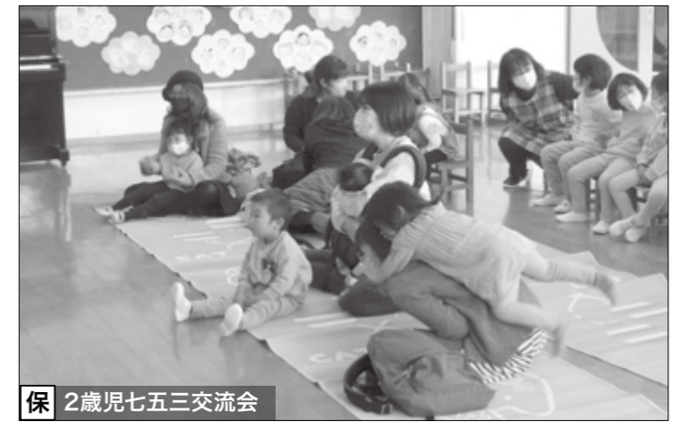
保 2歳児七五三交流会

小 学校 ▶ 加子母小学校では、学年毎に校外へ出掛けて学ぶ「生活科見学」「社会科見学」を行っています。