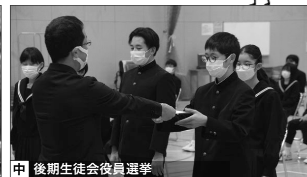
中 後期生徒会役員選挙