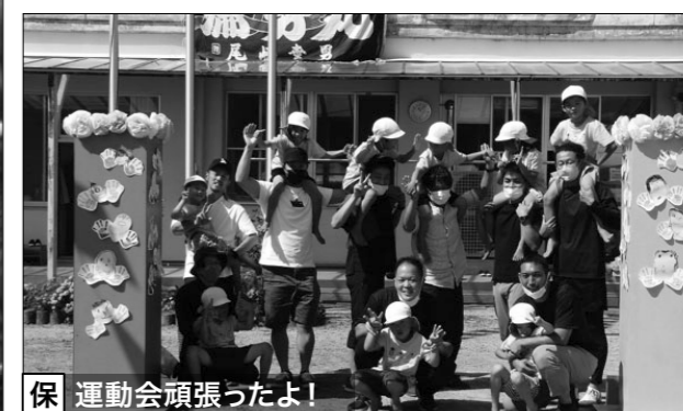
保 運動会頑張ったよ！

中 学校 ▶ 10月6日(木)には、新しい全校のリーダーを選出するための後期生徒会役員選挙を実施しました。全校のリーダーとして立った7人の生徒たちは、前期を振り返りつつ、後期に向かって、次のようなことを語りました。