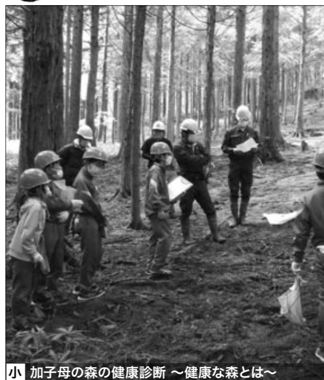
小 加子母の森の健康診断 ～健康な森とは～