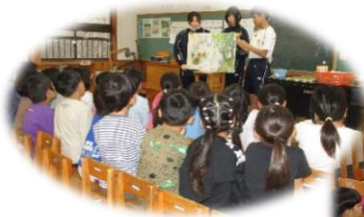
紙芝居・大型絵本の読み聞かせ

子どもたちは高校生の姿が見えるだけで大喜び！2 回目の時は「今日は〇〇ぐみに来てくれる人は誰ですか？」と子どもたちからアプローチしていました。高校生も「かわいい♡」と喜んでくれ、たくさん遊んでくれました。鬼ごっこでたくさん走らされて「ちょっと休憩！」と言っていた子もいました(*^-^*)子どもたちは疲れ知らずなので、全力で相手してくれる高校生が大好きです！これからも交流が続いていって欲しいです！