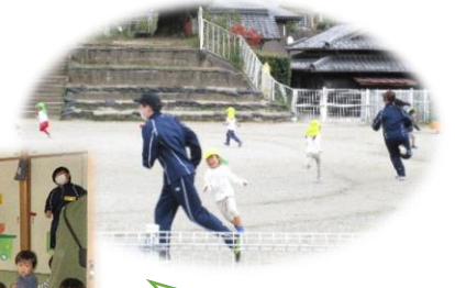
一緒にリズムや鬼ごっこ