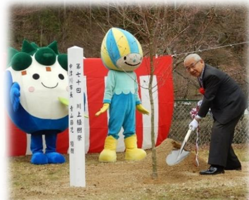
▲市長による記念植樹