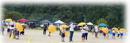
▲ クイズ！幸せの黄色い傘！

今年は、2年ぶりに「川上音頭」が復活し、保護者や卒業生も加わり踊ることができ素晴らしい運動会となりました。