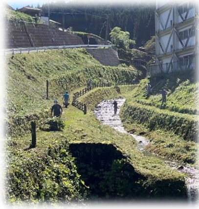
▲ 壁沢川での草刈作業

9月10日(土)、川上小学校と川上保育園の環境整備作業が開催されました。 当日は、小学校運動場の草取り、運動場周辺、壁沢川周辺の草刈り等、保育園園庭の草取り、保育園敷地周辺の草刈り等の作業が行われました。 作業は、保護者、学校職員その他、まちづくり推進協議会をはじめとした地域の皆さんが、児童、園児たちのために協力して進められ、きれいで気持ちの良い環境になりました。 作業に参加された皆様、お疲れ様でした。