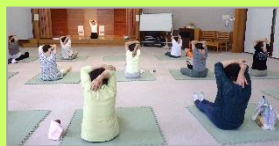
「お風呂上がりのストレッチ講座」