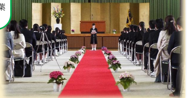
▲ 入学式、『新入生代表あいさつ』の様子