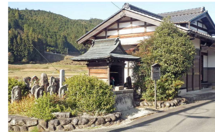
▲ 高部観音堂と石仏群 両脇には沢山の石造物が立ち並んでいる。

札所の御詠歌は、五・七・五・七・七の5句なる和歌で札所を賛美する内容のもので、お彼岸などには弘法大師を讃えて誕生和讃や追弔和讃を唱えておられるようです。