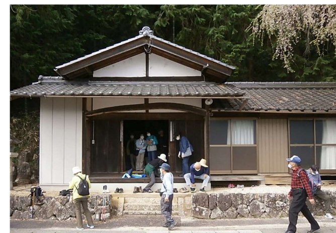
▲ 2021年4月歴史散歩で観音堂を見学しました。