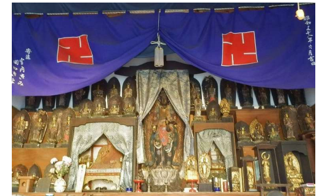
▲ 握観音堂内部 中央が十一面観音像 左弘法大師座像と十一面観音像を取り巻く三十三観音像

しばらく前までは、観音堂で数名のご婦人方による講が行われていました。その日は一重を携帯しお詣りをして世間話に花が咲く楽しいものであったと聞きます。今は、高齢化で集まれるご婦人方も居なくなってしまいました。この地域も信仰の厚い地域であったようです。