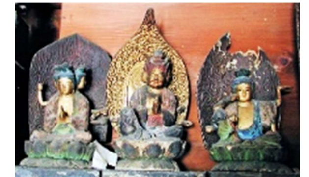
▲ 三十三観音像の一部 左から不空罽索観音、馬頭観音、如意輪観音