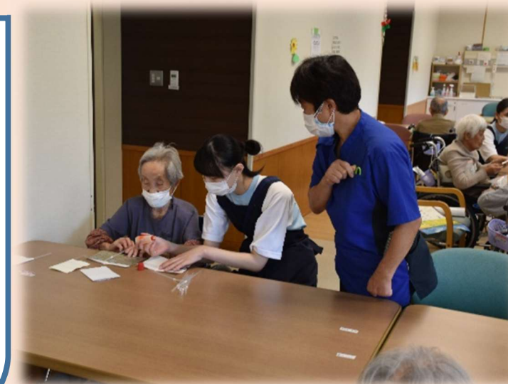
▲ 介護実習(レクリエーション)

坂下老健職員一同、これからも坂下高校と介護現場をつなぎ、将来地元で活躍する介護福祉士として出会えることを楽しみにしています。