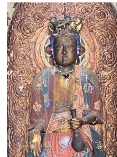
◀ 中津川市指定文化財 「十一面観音木像」 享保16年(1732)、下組庄屋等により発願造立、お堂に安置された。 高さ90cm