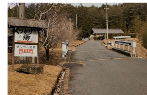
▲ くつかけの湯と峠へ伸びるすぐじ路

いずれにせよ、その湯元の冷泉には薬効があり現在も使われています。湯屋までパイプで冷泉を引き込まれ、わかし湯にし「くつかけの湯」として提供しておられます。湯屋を訪問しお話を聞きました。以前は「すぐじの湯」といっていたそうです。愛称「すぐじ」の道筋に「くつかけ」という場所がないかとたずねてみました。湯屋より上方に字「くつかけ」がありました。そこはちょっとした平地で大木があり、やはり旅人が履き物を替え休憩した所のように。傷んだ履き物を大木に掛け、旅の安全を願ったのでしょう。日本のあちこちに「杓掛(くつかけ)」地名が残っています。湯屋の主は、常連のお客さんもあり「くつかけの湯」をなんとしても守って行きたいと力を込めていわれました。