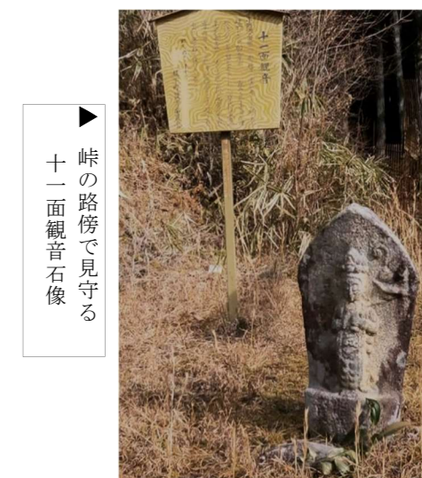
▶ 峠の路傍で見守る十一面観音石像