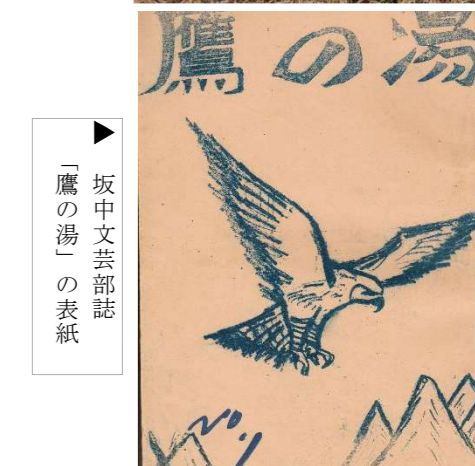
▶ 「鷹の湯」の表紙 坂中文芸部誌