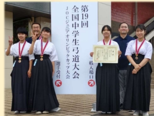
▲大会を終えた岐阜県代表チーム