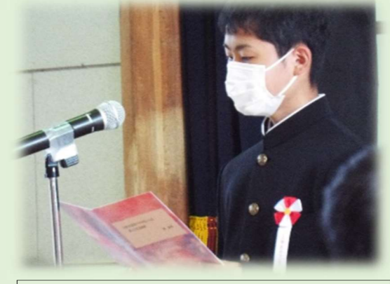
▲ 【入学式、『新入生代表あいさつ』】

4月8日(金)、9時から坂下総合体育館において令和4年度坂下中学校入学式が挙行されました。昨年度に続き今年度も、来賓の参観はありませんでしたが、保護者には各家庭2名までお越しいただき、感染防止策を講じる中、55名が坂中生の仲間入りをしました。新入生代表の生徒は「何事にも一生懸命に取り組んで充実した日々を送りたい。」と力強く語りました。坂中生の合言葉である『超升先輩』を体現する頑張りを見られるのが楽しみです。