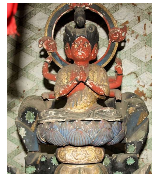
▲「元禄十五年」の墨書が台座に残る3面6臂馬頭観音像

▶平成14年新築された観音堂と内部の祭壇。中央厨子が馬頭観音、他は千手、如意輪、十一面、聖観音の4観音像。もう1体の准胝観音像が加われば「六観音」となる。