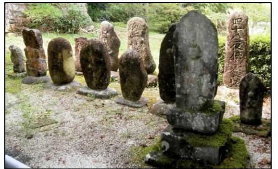
▲観音堂脇の石造物群

後方に「四十八夜供養塔」、最列前右の石仏は馬頭観音像で、「文化四丁卯年(1807年)二月吉日 外下ノ組若者中」と刻まれる。