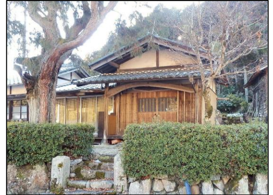
▲静かなたたずまいを見せる掘掛観音堂

この後より今日に至るまで掘掛観音として記録を残し地元が平和で穏やかであるよう祈願し続けて見えるようです。