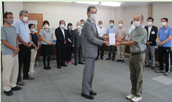
還暦実行委員会 長瀬委員長からまちづくり協議会会長へ