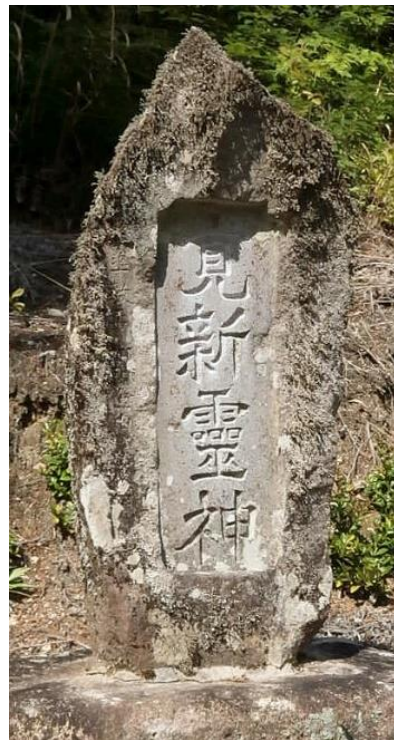
↑ 覚新霊神碑 大門島井田墓地内 たいへん熱心な御嶽行者で登拝88回を数えるという。 昭和34年建立