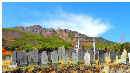
↑ 御嶽山と霊神碑群