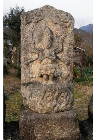
↑ 中之垣外古庵 左は念仏二十三夜塔 右は青面金剛石像