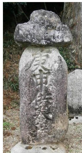
← → 握観音堂脇の二十三夜塔 握観音堂脇の庚申供養塔