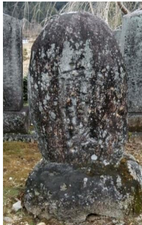
← → 高部観音堂脇の青面金剛石像 高部観音堂脇の庚申塔

諸々の信仰が複雑に習合した庚申信仰ですが、坂下の地区では講員等の願いは、実際どんな内容のものであったのでしょうか。今となっては、一人一人の思いを計り知ることが叶いませんが、日頃の生活と結びついた願いであったと想像されます。お話を伝え聞いている方がお見えでしたら是非お話しください。