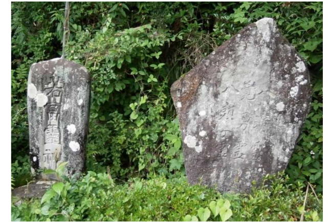
↑ 法力屋教会脇にある2体の霊神碑 左は「若富霊神」昭和11年建立 右は「八清霊神、覚勇霊神、八頭女霊神」昭和16年建立

町組乙坂のわが家へも、この地の行者と従者を2月の寒い頃に迎えていました。座敷の床の間に祭壇を設け御座儀礼が行われました。儀礼が始まると年寄りと一緒に儀礼の席に着かされ怖い思いを何度かさせられました。行者は般若心経を唱え徐々に神がかってくると体を震わせブツブツといい、携えている刃物がポンと飛び出したりします。私には何をつぶやいているか分かりませんが、主はあらかじめ家内安全などの願い事を伝えていて、その願いが叶うか否かの回答が従者を通して伝えられたのでしょうか。主はそれなりに納得していたように思われました。さらに10種類ぐらいの神札をいただきますが、後日この札をあちらこちらへ貼り付けて回るのが私の仕事でした。主は直会を催し行者一行をもてなし宿泊してもらい、行者は翌朝次の家を訪問していきました。