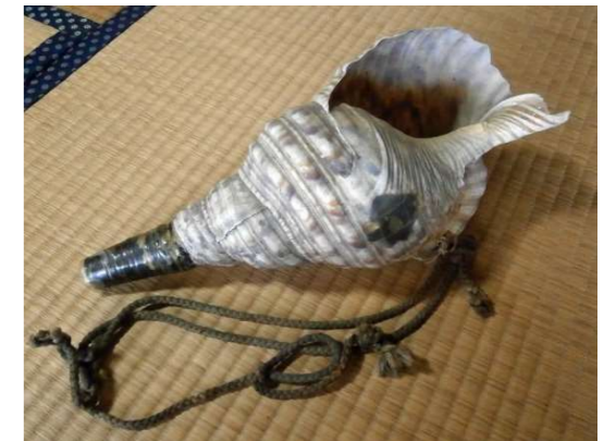
↑ 代々受け継がれた法螺貝