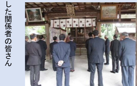
⇒ 顕彰祭に参加した関係者の皆さん