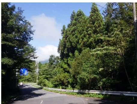
写真上 伐採前 / 写真下 伐採後

また全線の3分の1程度ですが、伐採された箇所は、空も広く、明るく、見通しが良くなり、停電の防止以外にも冬季路面凍結の軽減などが期待されます。