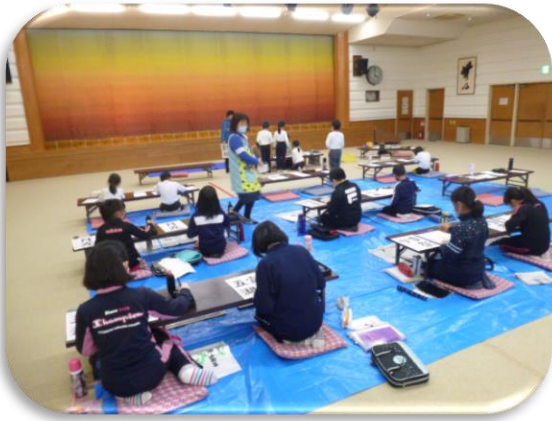
初日の習字教室の様子

「コロナ過で開催できない状態が続いていましたが、開催に向け、講師の先生やスタッフで対策を練り、間隔を開けるため広いホールに場所を変え、定期的に換気を行いながら万全の体制で始めました。みんな楽しみにしていた習字教室。先生の指導を受けながら一字一句真剣に書いていました。