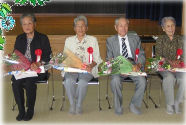
米寿おめでとうございます!(山口)