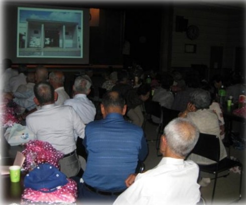
『木曾を訪ねて』写真で紹介(山口)