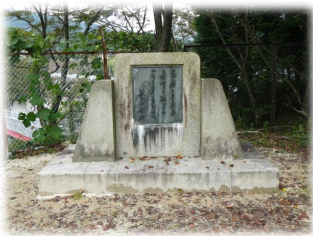
移転を終えた「葉山嘉樹文学碑」(落合)