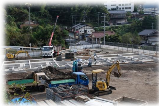
現在、基礎工事中です