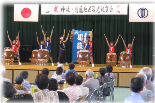
演目を楽しみながらの祝宴(神坂・馬籠)