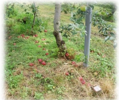
昨年はりんごも落とされてしまいました(青野原)

被害が深刻な場合、猟友会の協力を得て、銃器やおりをを用い、被害防止する方法もあります。まずはイノシシやサルの特徴や生態を知り、被害を防ぐポイントを知ることが重要です。