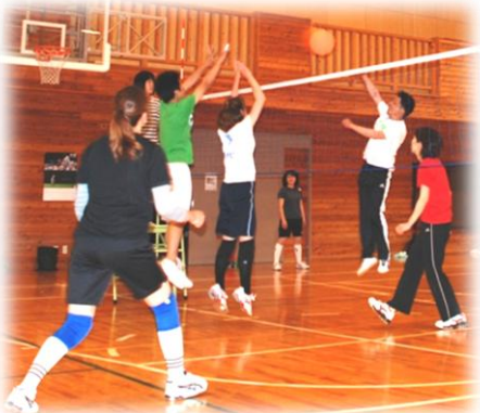
ポイントの行方は？力のこもったプレーが続出！！