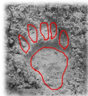
クマの足はこんな感じでしょうか..

ここ数年、山口地区の各所でも野生動物の被害が報告されており、とりわけイノシシ・サルによる農作物への被害は年々深刻になっています。