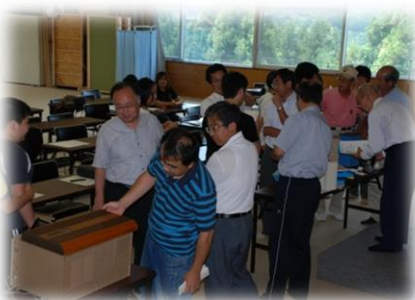
講演会終了後、あらためてそのしくみに関心！

紙を筒にしてその中に息をふきかけると、手に暖かさが伝わる。この紙の性質を利用し、室内の空気を排気するときに、その熱を吸気の空気に移動させるのが全熱交換器「ロスナイエレメント」だということなど、対象はやさか地区・神坂地区の児童、生徒の皆さんでしたが、大人でも十分聞きごたえのある内容でした。