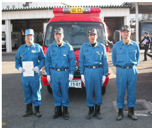
ポンプ車を受け取る山口分団第2部の皆さん

市が21年度購入したポンプ自動車は山口分団第2部に配置されました。火災を起こさないことが前提ですが、もしかの時には、強力な助っ人となることでしょう。