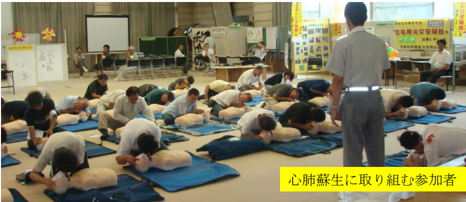
心肺蘇生に取り組む参加者

平成21年9月1日 第49号 (毎月1日発行) 中津川市 山口総合事務所 (0573) 75-2126