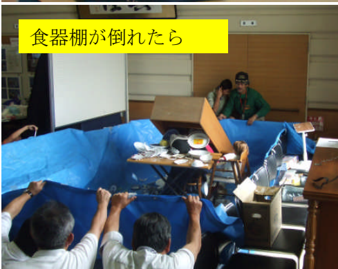
食器棚が倒れたら