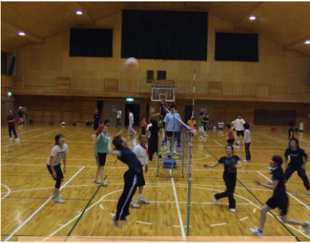
親子、隣人みんな楽しくジャンプ、アタック!!

住民のスポーツ振興を図るために、今年度から各町内会選出の体育委員の皆様に参加の取りまとめをお願いしました。参加チームは、25 町内会中 8 町内会 9 チームでした。参加された方々は、久しぶりにいい汗をかかれ楽しそうでした。