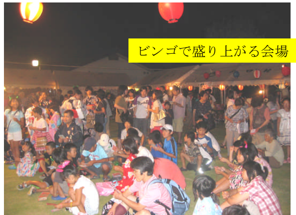
ビンゴで盛り上がる会場

8月22日(土)に椿苑夏祭りが開催されました。午前中の雨とは、うって変わった快晴でした。地元の方による屋台の出店が囲む中、黎明太鼓の演奏や、子どもたちによるキッズビクスの催しを楽しみ、木曾節を踊りながら親睦を深めました。最後は、山口の夜空を打ち上げ花火が彩りました。