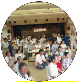
多くの方が熱心に学ばれました

今後起こりうる災害による被害を少しでも減らすための意識付けにつながっていくことが期待されます。