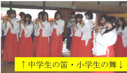
↑中学生の笛・小学生の舞↓

あいにくの雨となった例祭でしたが子どもたちが楽しみにしている祭りです。浦安の舞、笛などこの日のために練習したものを神様に奉納できました。今年も豊作になるといいですね。