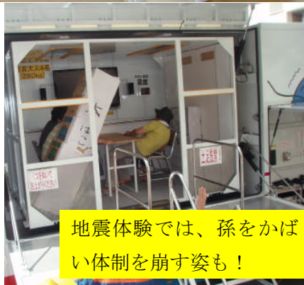
地震体験では、孫をかばい体制を崩す姿も！