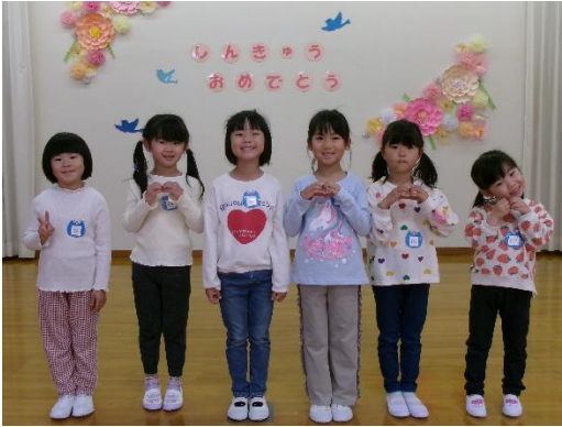
▲ 年長さんになりました (山口こども園)