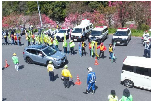
▲ 道の駅賤母で交通安全を呼びかけました

花が咲き誇る椿街道を楽しみながら馬籠から通っています。趣味は散歩で、各地を歩いて歴史を学び、自然に触れ、山口への理解を深めたいです。よろしくお願いいたします。