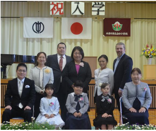
▲ ピカピカの1年生です (山口小学校)