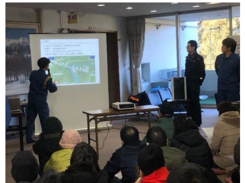
▲公民館での説明の様子