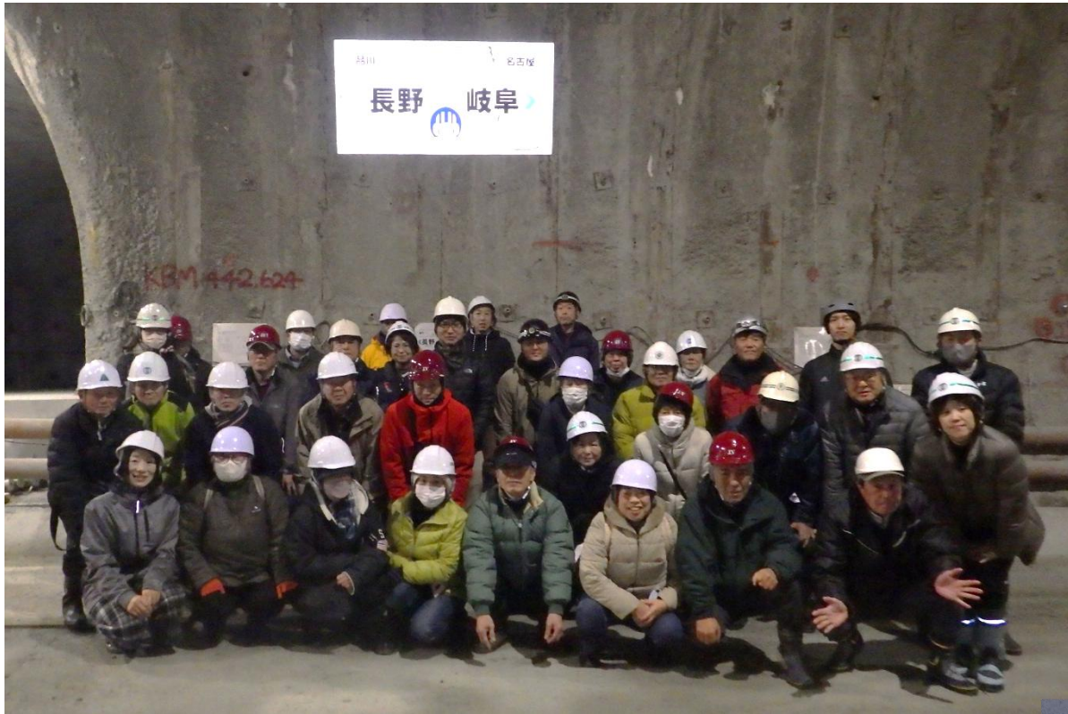
▲トンネル内にある県境の表示看板の前で記念撮影

1月31日、山口地区リニア中央新幹線対策協議会委員と山口まちづくり協議会役員等の皆さんが、リニア中央新幹線関係地の工事現場の見学会を行いました。