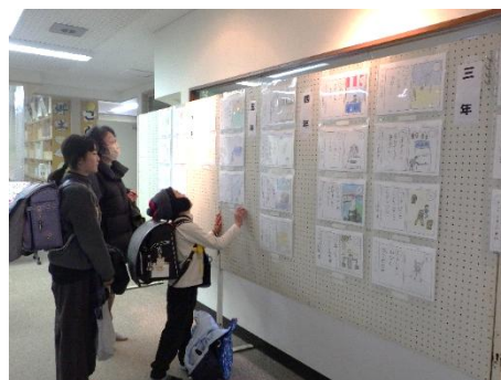
▲山口公民館での展示の様子

作品は、1 月下旬から 2 月中旬にかけて、ショッピングセンターサラと各公民館で展示を行いました。