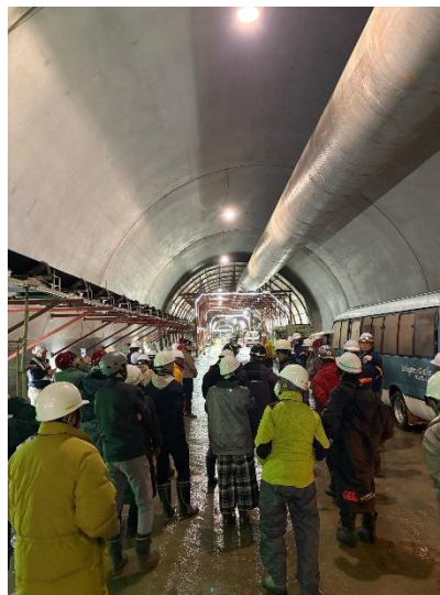
▲トンネル内は明るく、安全に配慮されていることが各所でうかがえます

通常では見ることができない工事現場を見学し、工事内容や構造などについてJR東海や関連会社の方々からの丁寧な説明を受け、参加者はリニアへの理解が深まるとともに、完成への期待が増したようです。