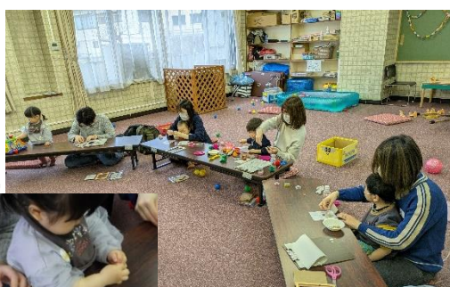
◀ 記念品制作で「手形アート」を親子で楽しみました

最終日のこの日は、子育て中のお母さんの心の健康について講義を受けたあと、記念品づくりとして「手形アート」を楽しみました。