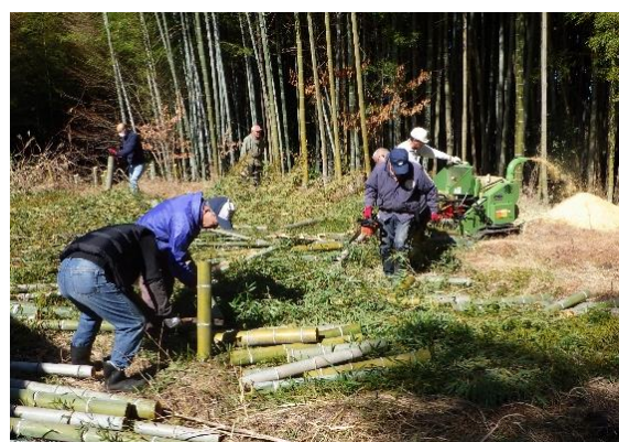
▲生活環境部会の皆さんによる竹切り作業

3月1日は、生活環境部会の皆さんが、「美しいまちづくり景観整備事業」の一環として椿街道（弥栄トンネル付近）沿道の竹切り作業を行いました。 また、3月9日には地域振興部会の皆さんが、賤母の森（道の駅賤母向かい側）のつつじの剪定やつるなどの伐採作業を行いました。