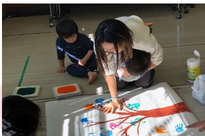
▲みんなの手で大きな木を作りました ※出来上がった作品は、山口公民館で12月下旬に展示します