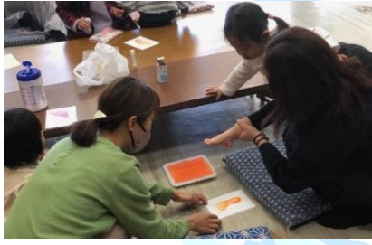
▲手形・足形を使って可愛いリスの手形アートも作りました