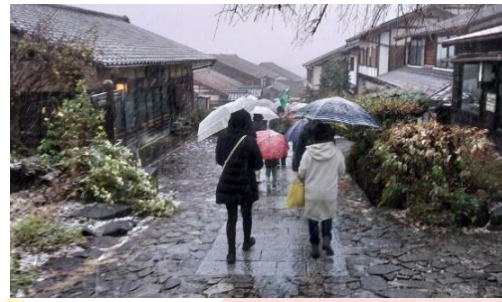
▲石畳を散策する参加者