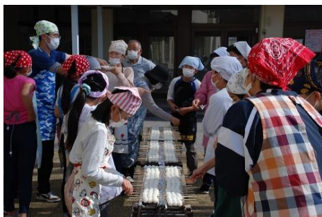
▲指導により白焼きをする小学生

団子とタレづくりでは、はじめはいざ串に刺そうとするところが崩れたりしていましたが、講師の指導と手直しを受けながら140本の五平餅が出来ました。