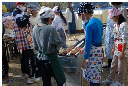
▲タレのついた五平餅を焼く小学生