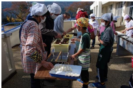
▲五平餅にタレをつける小学生