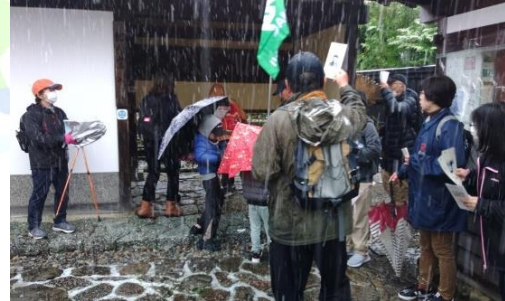
▲藤村記念館で説明をうける参加者

11月18日、山口公民館主催のやさか公民館講座「文化歴史ウォーキング中山道馬籠宿を歩こう」が行われました。