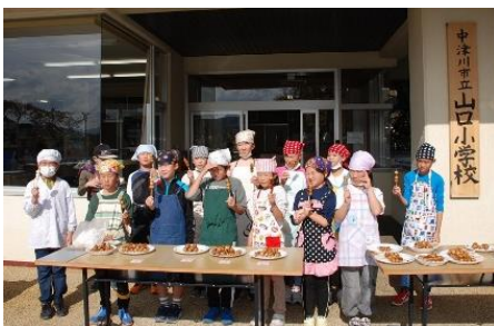
▲出来た五平餅を持って集合写真

焼くときは、専用のコンロを準備していただき、白焼きからはじまり、焦げ目がついたらタレをつけて焼きました。周辺にはおいしそうなおいが漂い、子どもたちは食べたいのを我慢して140本すべてを焼き終えました。焼き終えて一口食べた感想は、どの子も「おいしい」の一言でした。4・5年生の子どもたちは、全校児童と全職員に、自慢の五平餅をふるまいました。 お米作りから五平餅づくりまで、ご尽力いただいた多くの方々に感謝いたします。ありがとうございました。