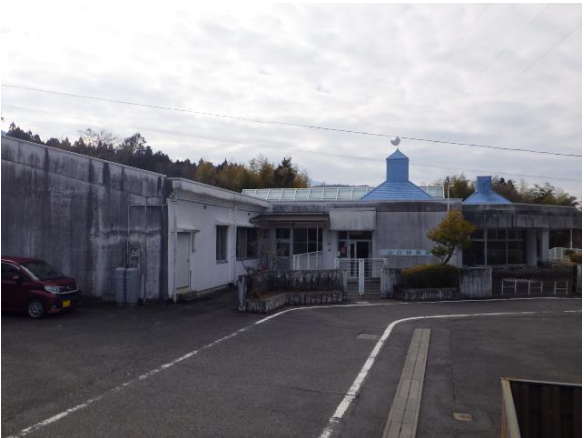
(写真2)令和4年3月現在の園舎風景