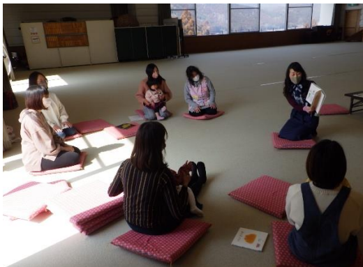
閉級式での読み聞かせの様子